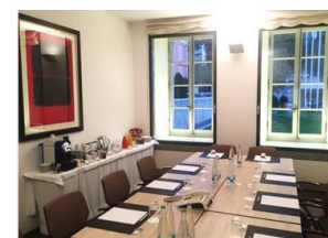
Tableau des capacités des salons

Au 1 er étage de notre pavillon Angleterre, ce salon est idéal pour travailler en petit groupe.